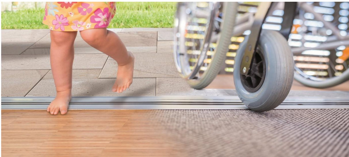
Bild 1: Die passivhauszertifizierte „Magnet-Nullschwelle“ von ALUMAT lässt sich mit allen gängigen Türprofilen kombinieren und erreicht höchste Dichteklassifizierungen. www.alumat.de

Elegant und schwellenlos lässt sich die Magnet-Nullschwelle mit allen gängigen Türprofilen, egal ob aus Holz, PVC oder Alu, kombinieren. ALUMAT kann in Verbindung mit jedem großen Profilhersteller und allen gängigen Profilen offizielle Prüfzeugnisse mit technischen Bestwerten vorweisen. Diese breitaufgestellte Sicherheit mit zahlreichen geprüften Kombinationsvarianten ermöglicht Gestaltungsfreiheiten, die aktuell nur mit der Magnet-Nullschwelle möglich sind.