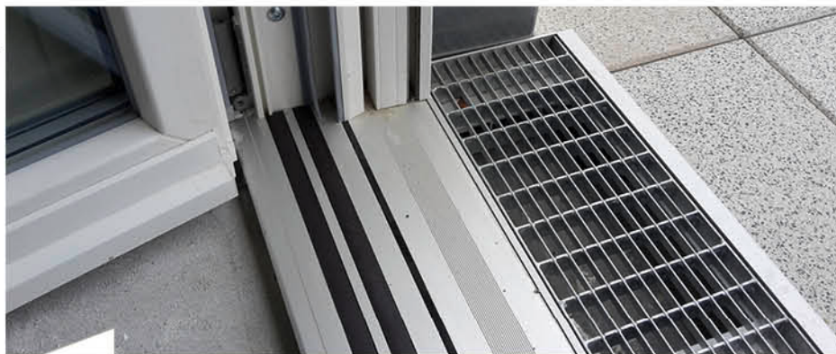
Auf diesem Bild ist die eingebaute Magnet-Doppeldichtung noch ohne Fertigfußboden im Innenraum zu sehen. Falls die Fußböden über geringere Aufbauhöhen verfügen, kann das Aluminium-Bodenprofil der Magnet-Doppeldichtung diesen Höhenunterschied ausgleichen. Es muss in solchen Fällen nur leicht nach unten geklopft werden.