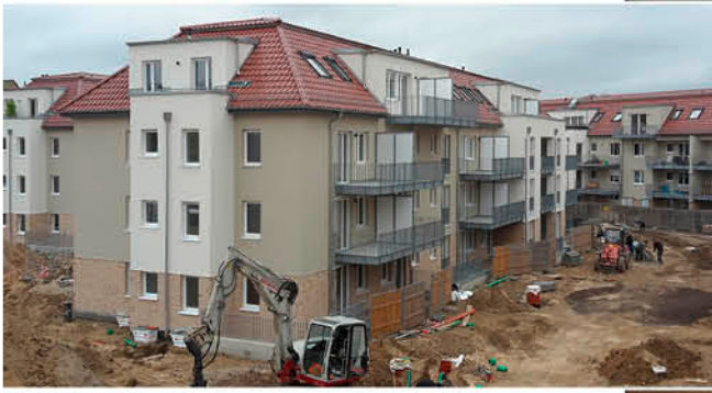
Das Objekt während der Bauphase