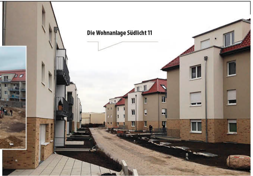
Die Wohnanlage Südlicht 11

renschwellen zwischen 1 und 15 cm Höhe. Die durchgängige Schwellenfreiheit dieser Wohnanlage im Töpchiner Weg ermöglicht eine komfortable Nutzbarkeit für alle und eine anpassungsfähige Vermietbarkeit für die GBSt. Die Gestaltung der Wohnungen überzeugte die Mitglieder der Baugenossenschaft, im Februar 2016 konnten die letzten freien Wohnungen vergeben werden.